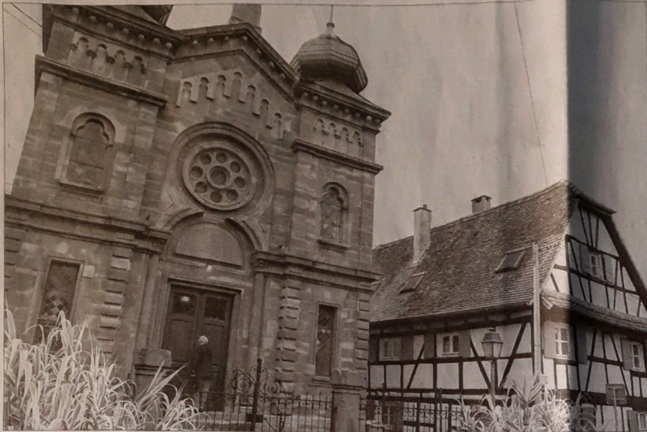
L'édifice a été construit en 1897 avec sa façade monumentale en trois parties et ses deux tours surmontées de bulbes.